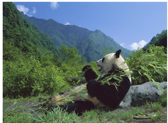
le panda dans la nature

Le panda est un animal qui vit dans les forêts d'Asie.