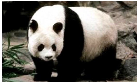
le panda dans un zoo

Le panda est un animal en voie de disparition et il est devenu le symbole du Fonds mondial pour la nature